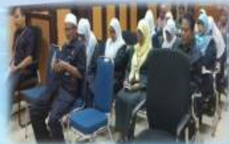
Gambar 1.2 : Suasana Rapat Pengadilan Agama Payakumbuh Kelas IB