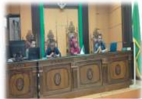
Gambar 6.1 : Ekspos hasil pengawasan Pengadilan Agama Payakumbuh Kelas IB oleh Hakim Tinggi Pengawas Daerah PTA Padang

Disamping pengawasan sebagaimana tersebut di atas, pengawasan dilakukan oleh atasan langsung atau yang disebut juga