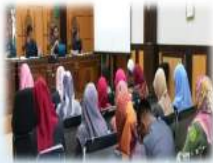
Gambar 1.1 : Suasana Sesi/ruang Pengadilan Agama Payakumbuh Kelas IB