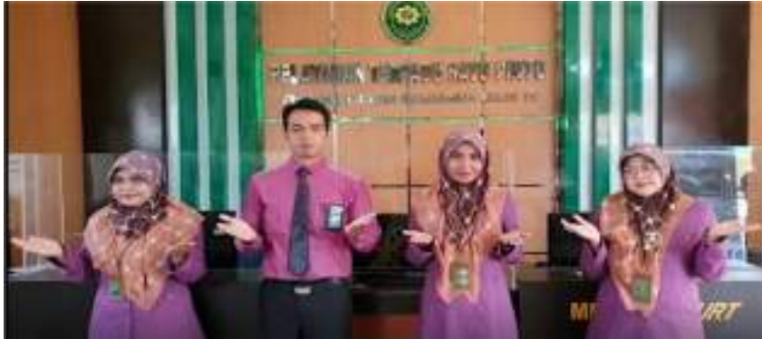
Gambar 5.1 : Pelayanan Terpadu Satu Pintu Pengadilan Agama Payakumbuh Kelas IB

pembayaran dan pengembalian panjar biaya perkara, hingga penyerahan/pengambilan produk Pengadilan melalui satu pintu.