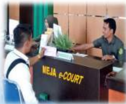
Gambar 4.1 : e-Court Pengadilan Agama Payakumbuh Kelas IB

Aktifasi e-court Pengadilan Agama Payakumbuh Kelas IB dilakukan pada bulan Nopember 2018 oleh Tim dari Mahkamah Agung RI. Kemudian disosialisasikan kepada advokat, bank serta seluruh pegawai Pengadilan Agama Payakumbuh Kelas IB awal bulan November 2018.